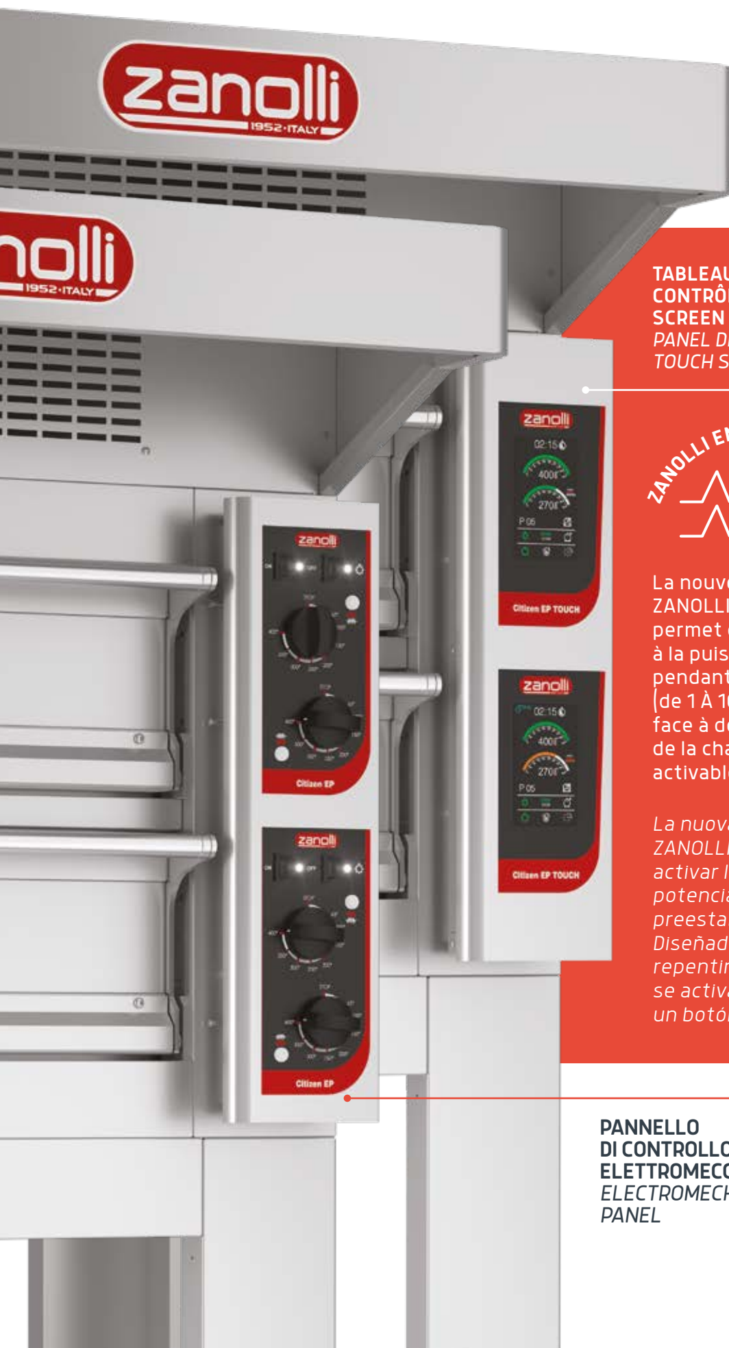
TABLEAU DE CONTRÔLE TOUCH SCREEN PANEL DE MANDOS TOUCH SCREEN